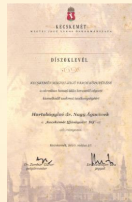
Kecskemét Megyei Jogú Város Közgyűlése Kecskemét Ifjúságáért Díj 2010.