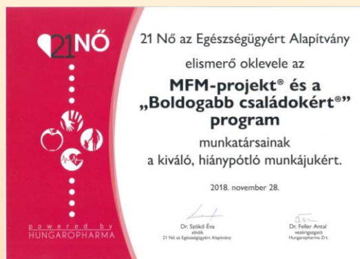
21 Nő az Egészségügyért Alapítvány elismerő oklevele 2018.