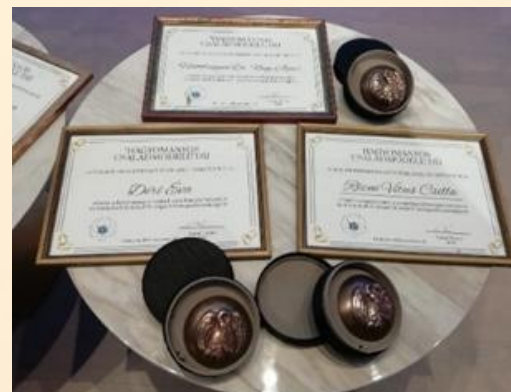
„Hagyományos családmodell” Díj Családtudományi Szövetség 2022.