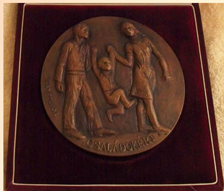
Szociális és Családügyi Minisztérium CSALÁDOKÉRT DÍJ 2002. Emberi Erőforrások Minisztériuma PRO FAMILIIS DÍJ 2016.