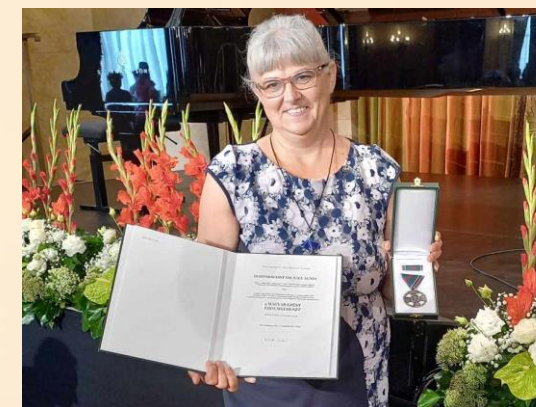
Magyar Ezüst Érdemkereszt Magyarország Köztársasági elnöke 2023.