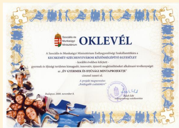
Szociális és Munkaügyi Minisztérium Mintaprojektje 2008.